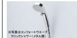
※写真はコンフォートウエーブクリックシャワー(メタル頭)