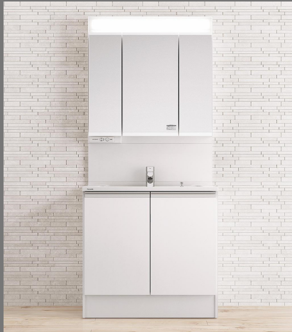
※イメージ写真（画像の仕様詳細は、ご提案のプランと異なる部分があります）