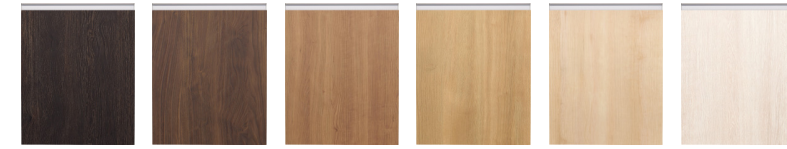
スモークオーク柄 ウォールナット柄 チェリー柄 オーク柄 マーブル柄 ホワイトオーク柄